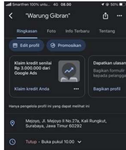
Gambar 2. Pembuatan Google Maps

menunjukkan hasil yang signifikan. Penggunaan Google Maps dapat menjadi alat yang sangat efektif bagi UMKM untuk meningkatkan daya saing dan dapat memanfaatkan Google Maps secara optimal dan beradaptasi dengan tuntutan pasar yang semakin digital.